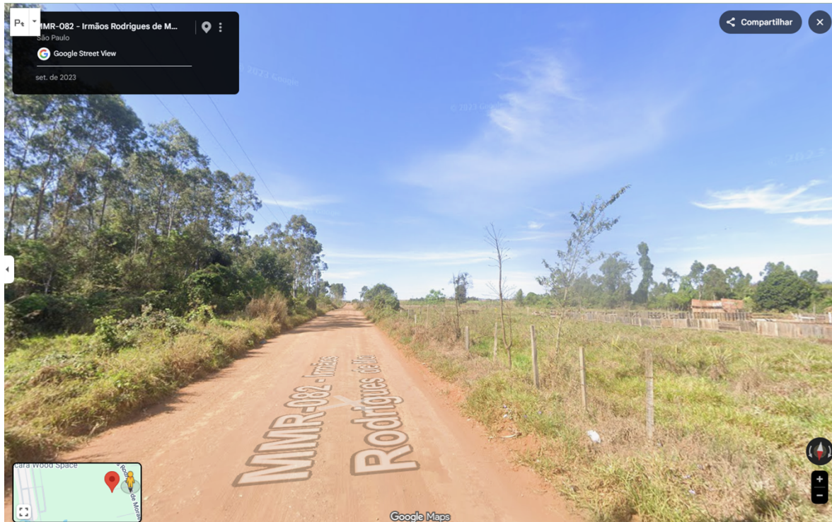
Imagem 2 – Vista da Estrada MMR-082, demonstrando o trecho em estrada de terra.

DOCUMENTO ASSINADO DIGITALMENTE - PROTOCOLO:1338/2026 - 12/06/2026 - 15:55 - 8X16-A8XP-99MJ-8CT4