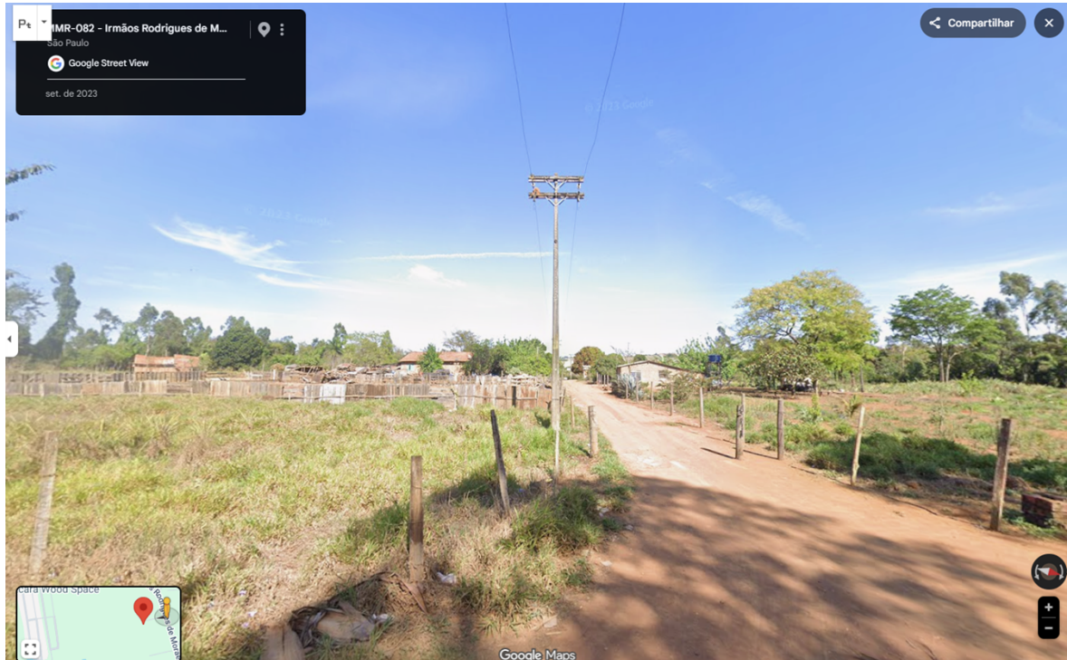
Imagem 3 – Acesso rural e imóveis nas imediações da Estrada MMR-082.